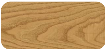
Madera de Castaño Chestnut Timber