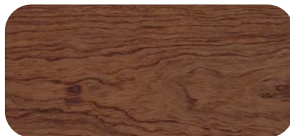
Madera de Bubinga Bubinga Timber