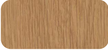
Madera de Roble Oak Timber