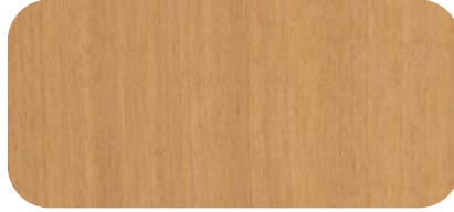
Madera de Mukaly Mukaly Timber