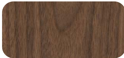
Madera de Nogal Walnut Timber