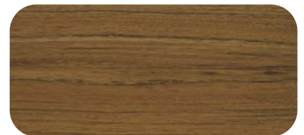
Madera de Mongoy Mongoy Timber