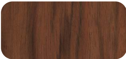
Madera de Etimoe Etimoe Timber