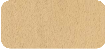
Madera de Haya Blanca White Beech Timber