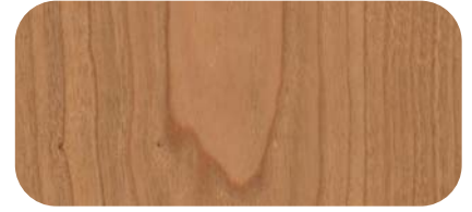
Madera de Cerezo Cherry Timber