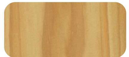
Madera de Pino País Spanish Pine Timber

Working with timber is always a learning and discovering process. Grain, colour and texture are the most important features when choosing timber. Each piece is unique and any other piece coming from the same tree, even the same board, is different.