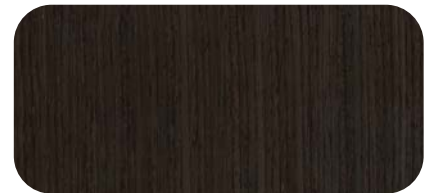
Madera de Wengue Wengue Timber