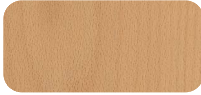
Madera de Haya Vaporizada Steamed Beech Timber