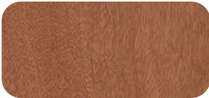
Madera de Cedro Cedar Timber