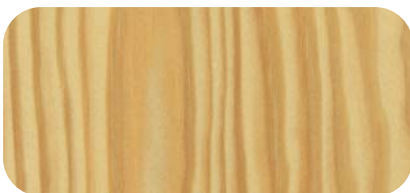
Madera de Pino Melis Melix Pine Timber

Debido a motivos técnicos de impresión los colores aquí reflejados pueden diferir de los originales.