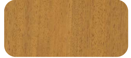
Madera de Iroko Iroko Timber